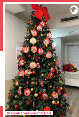
Residenza San Giovanni (CO)

Con un totale di 490 like (e con 157 solo su questa foto!) la Residenza comasca si aggiudica il podio nel contest dedicato agli addobbi di Natale!